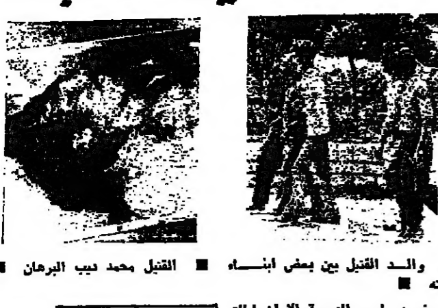
القنصل محمد ديب البرهان

وقعت جريمة قتل في حلبا، قرب النهر، عندما حاول مطلوب اجتياز حاجز تفتيشي في منزل حليا الشمالي دون أن يملك لاشارة التوقف.